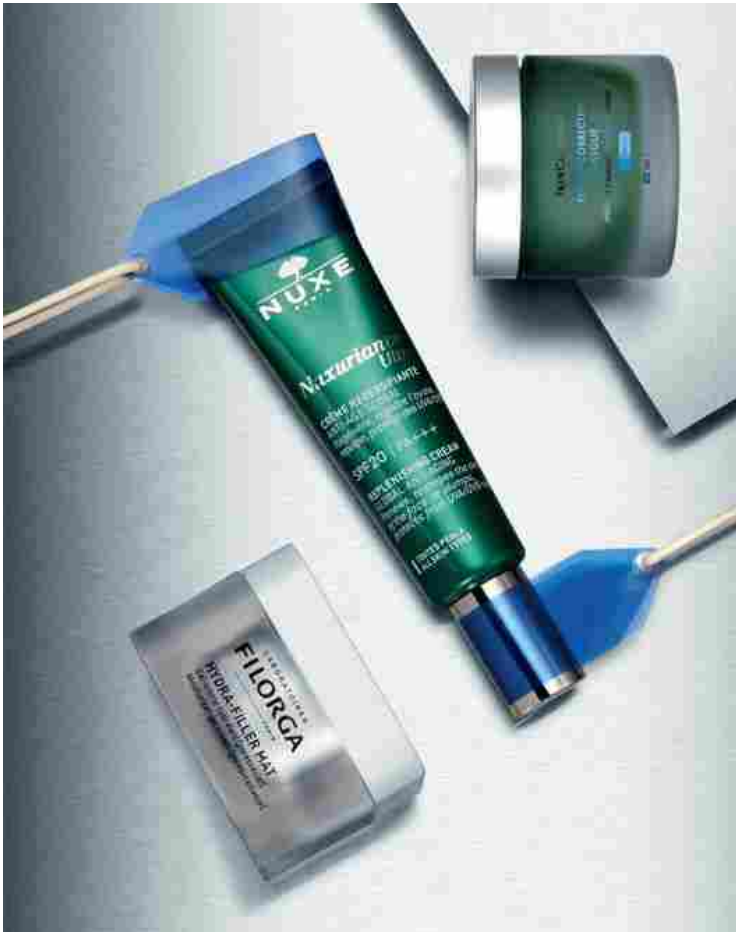
Still life Massimiliano De Biase. Styling Eva Orbetegli