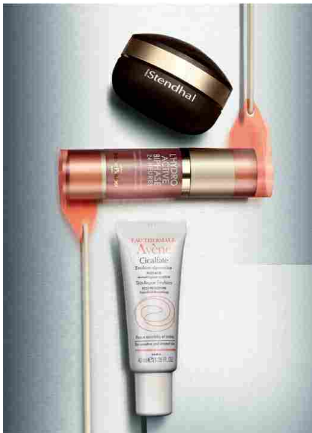
Pur Luxe Premier Geste Global Anti-Age, Stendhal. L'Hydro Active Biphase, Méthode Jeanne Piaubert. Cicafate, Eau Thermale Avène.