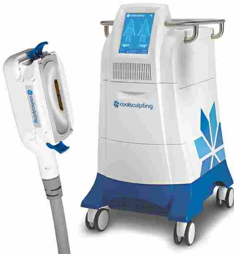
CoolSculpting, Image Regenerative Clinic.

impossibile. Ma non solo, anche se si sta attenti all'alimentazione e si fa regolare attività fisica alcuni accumuli adiposi sono difficili da smaltire. Quindi la soluzione più ovvia sembrerebbe ricorrere alla chirurgia estetica, ma per fortuna i tempi del "tutto o niente" sono finiti, troviamo molti trattamenti che apportano quasi gli stessi risultati di una liposuzione senza essere così invasivi e senza i fastidiosi tempi di recupero.