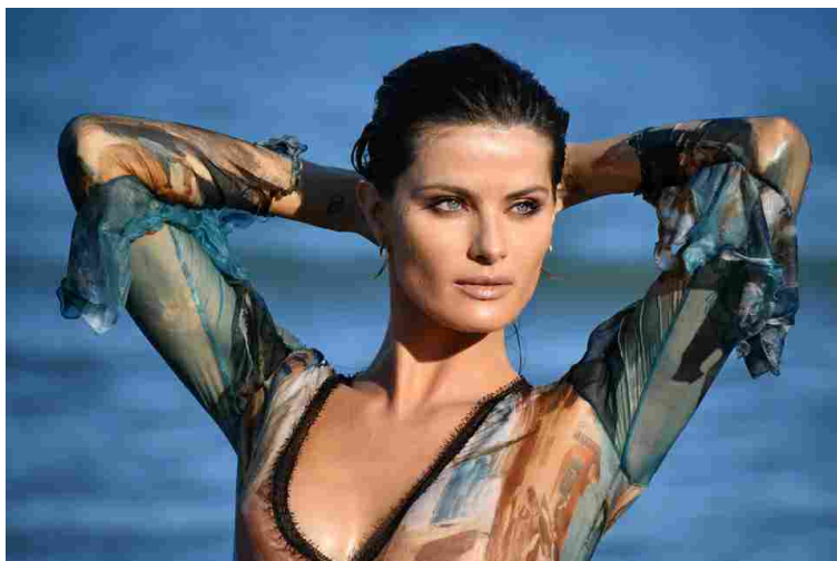
Isabeli Fontana

Chissà se la mattina della passeggiata in laguna, con cui ha inaugurato la 74esima Mostra del Cinema di Venezia, Isabeli Fontana si è svegliata con lo sguardo perfettamente fresco e riposato che ci appare nei servizi fotografici. Di certo sappiamo che Pablo Ardizzone, make up specialist di Shiseido , aveva in serbo un suo personalissimo rimedio per assicurare occhi da primo piano alla top model più corteggiata del festival (così come alle dive di cui ha curato il look durante tutta la kermesse veneziana): «Metto in freezer per un quarto d'ora Glow Revival Eye Treatment Bio-Performance di Shiseido e lo applico prima del trucco con un lieve massaggio. Le proprietà rigeneranti di questo gel, abbinato al freddo, esercitano un effetto istantaneo sullo sguardo che diventa subito disteso, più luminoso e perfettamente idratato».