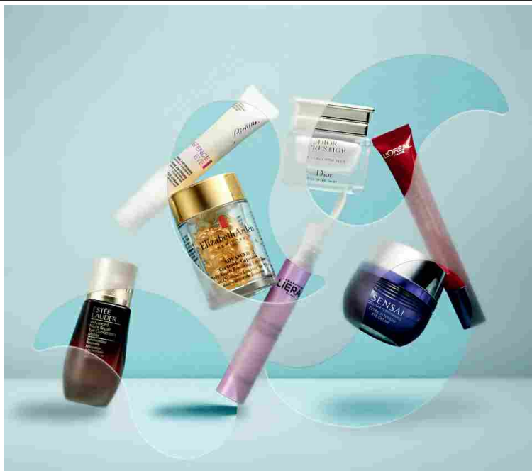
Advanced Night Repair Eye Concentrate Matrix, Estée Lauder. Defence Eye Crema Antirughe, BioNike. Advanced Ceramide Capsules for Eyes, Elizabeth Arden. Dior Prestige Le Concentré Yeux, Dior. Lift Integral, Lierac. Revitalift Laser X3, L'Oréal Paris. Extra Intensive Eye Cream, Sensai. (Still life Massimiliano De Biase. Styling Eva Orbetegli).