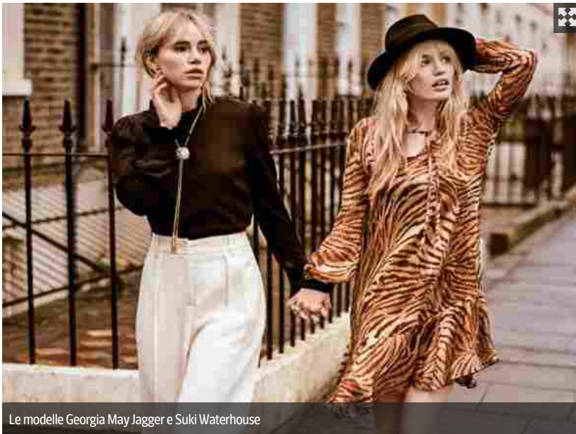
Le modelle Georgia May Jagger e Suki Waterhouse

C'è luogo e luogo. Quello in cui si vive può avere un ruolo importante nell'invecchiamento e nelle diverse problematiche cutanee perché il clima è un fattore da non trascurare mai. In Florida come in Australia, ad esempio, sotto il sole buona parte dell'anno, non si dovrebbe fare a meno di filtri solari. A Milano, ma