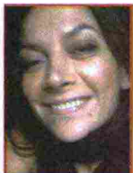
di Francesca Marotta