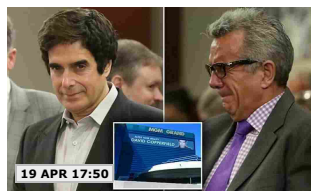
19 APR 17:50