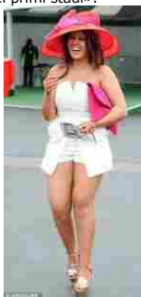
SI PUO' SORRIDERE DELLA CELLULITE

La tecnologia di ultima generazione è la piattaforma Coaxmed Biotec: permette di trattare tutti i tipi di cellulite oltre che la lassità cutanea sfruttando l'azione sinergica di radiofrequenza, ultrasuono a bassa frequenza e vacuum modulato. Un sistema di raffreddamento rende la metodica confortevole e indolore.