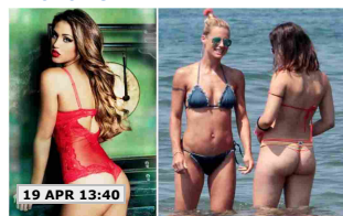
19 APR 13:40